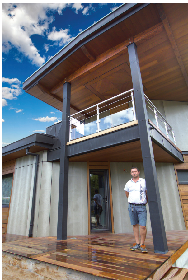
Damien Perrin, devant l'une de ses récentes réalisations.

Contact SRT Charpente : 04 76 63 15 33 ou 06 09 43 37 89 www.srtrenovation.com + sur les Compagnon du Devoirs : www.compagnons-du-devoir.com